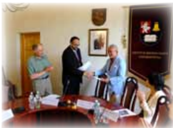
協同研究事業について合意

コアジサシの渡りについて解明するために、海外との協同研究事業を始めました。現在、リトアニア教育大学との間で、ヨーロッパにおける渡りルートの解明について協同研究を進めています。