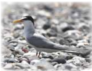
コアジサシ（学名： Sternula albifrons ）