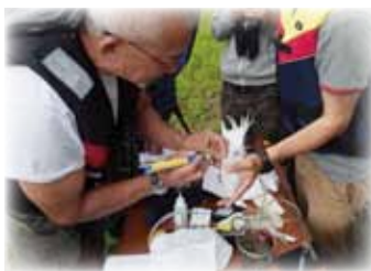
リトアニアでの活動